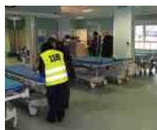
Cona, arrivano misure anti-sovrappollamento