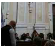
Unione Terre Fiumi, sanità e turismo al centro del consiglio