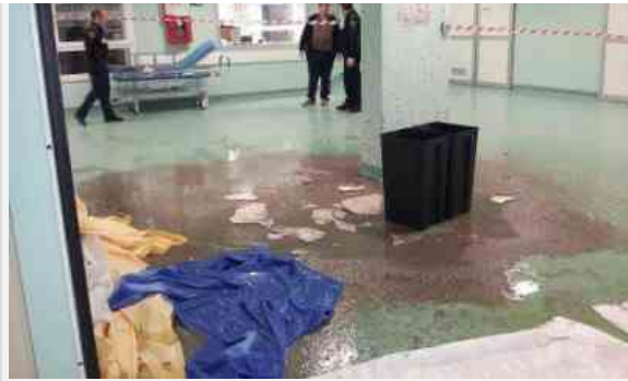
Il triage del pronto soccorso dopo la caduta dei liquami

organico - a utilizzare padelle in plastica pluriuso che dovranno pulire e igienizzare manualmente. "Questo riporta il nosocomio indietro nel tempo in termini di strumentazione assistenziale di più di 20 anni - prosegue Ferraresi -. Ci chiediamo quali saranno le ricadute igienico-sanitarie sui pazienti ricoverati, sul carico di lavoro che si sta prospettando indecoroso e scandaloso per i lavoratori impiegati nella loro assistenza".