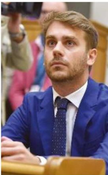
Il deputato Vittorio Ferraresi annuncia una interrogazione