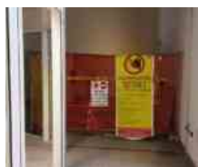
Cona, chiusura provvisoria ingresso Settore 3