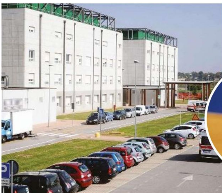
BATTAGLIERO Il deputato del Movimento 5 Stelle, Vittorio Ferraresi (nel tondo) all'attacco dell'ospedale di Cona