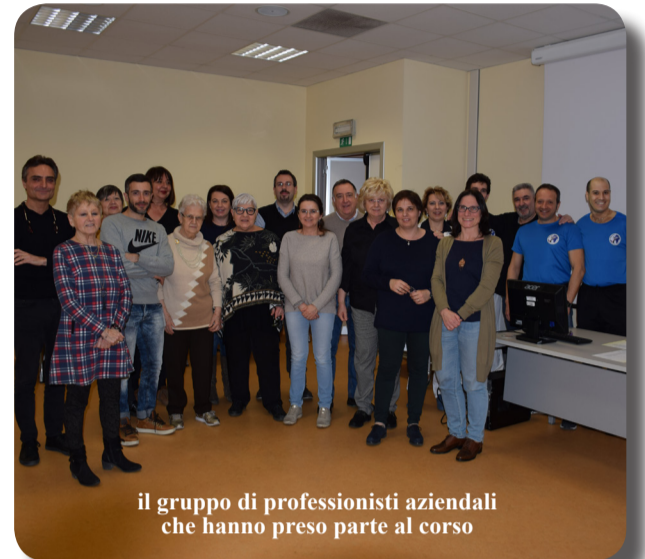
il gruppo di professionisti aziendali che hanno preso parte al corso

Scopo del corso, acquisire o migliorare le competenze di comunicazione ed eventualmente di autodifesa in situazioni critiche.