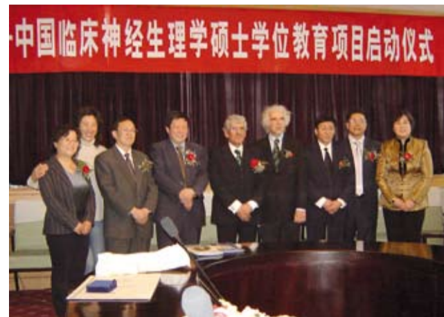
Sopra: foto di gruppo con lo staff scientifico-amministrativo della Capital University, i rettori delle quattro università cinesi e i due direttori italiani del Master.

La Fondazione Cassa di Risparmio di Ferrara e la Cassa di Risparmio, che da tanti anni hanno dato credito e fiducia alle attività formative e scientifiche della Clinica Neurologica universitaria, consentiranno verosimilmente - durante lo svolgimento del Master - l'avvio di progetti scientifici collaborativi con i ricercatori della Capital University of Medical Sciences di Beijing.