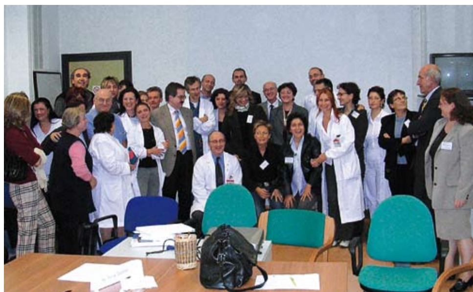
Il team del Dipartimento di Riabilitazione

Per tutti i dipartimenti il percorso è iniziato con la nomina dei referenti per l'AccREDITAMENTO (a livello di Dipartimento e di U.O.) e con la redazione del documento di presentazione ("Manuale Qualità"), nel quale la struttura descrive la propria organizzazione. Finora i dipartimenti che hanno raggiunto l'accREDITAMENTO sono quello di Riabilitazione (S. Giorgio), Neuroscienze ed Emergenza, mentre è in corso di accREDITAMENTO il Dipartimento Chirurgico.