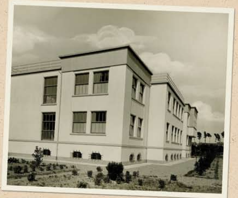
Il padiglione dell'Ostetricia