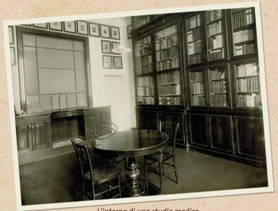
L'interno di uno studio medico