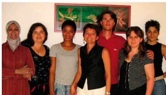
Lo staff dell'Ufficio Accoglienza e Mediazione

Da tempo il tema dell'accoglienza in ospedale è al centro dell'attenzione delle politiche sanitarie: saper accogliere un paziente, che in genere si trova in una situazione di sofferenza e malattia, aiutarlo a orientarsi all'interno della struttura ospedaliera, accompagnarlo nell'utilizzo dei servizi durante la degenza sono diventate attività sempre più importanti per la qualificazione dell'assistenza. Inoltre, le dinamiche comunicative in continua evoluzione, che nascono dalla crescente complessità sociale, richiedono l'utilizzo di strategie di dialogo e comunicazione capaci di vera accoglienza.