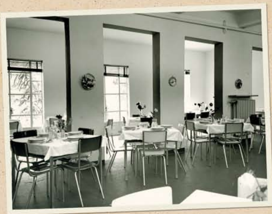
La sala da pranzo per i pazienti