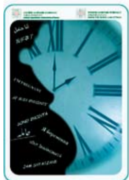
Sopra: La copertina di Sono incinta Sotto: il team delle mediatrici culturali

Sono incinta è il titolo di un piccolo volume pensato per accompagnare e orientare le donne che aspettano un figlio. È proposto nelle nove lingue che si parlano più diffusamente tra le future madri all'interno dell'Azienda Ospedaliero-Universitaria, grazie anche alla consulenza di mediatrici e mediatori culturali (albanese, arabo, cinese, francese, inglese, italiano, rumeno, russo, urdu).