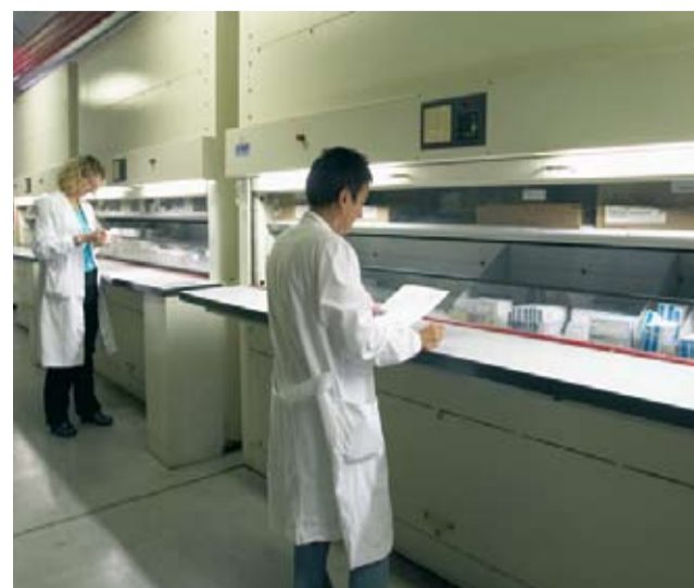
Addetti del Dipartimento Farmaceutico del S. Anna al lavoro

Il Dipartimento Farmaceutico Interaziendale nella programmazione del budget per una maggiore attenzione ai pazienti e un contenimento della spesa