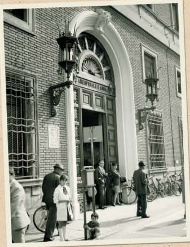
L'ingresso dell'Ospedale S. Anna

Cogliamo l'occasione per ringraziare il personale della Biblioteca ospedaliera per il lavoro di raccolta e manutenzione del materiale.