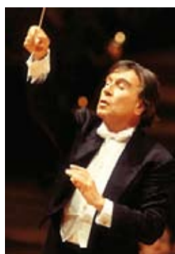
A lato: Uto Ughi Sopra: Claudio Abbado Sotto: il dott. Florio Ghinelli