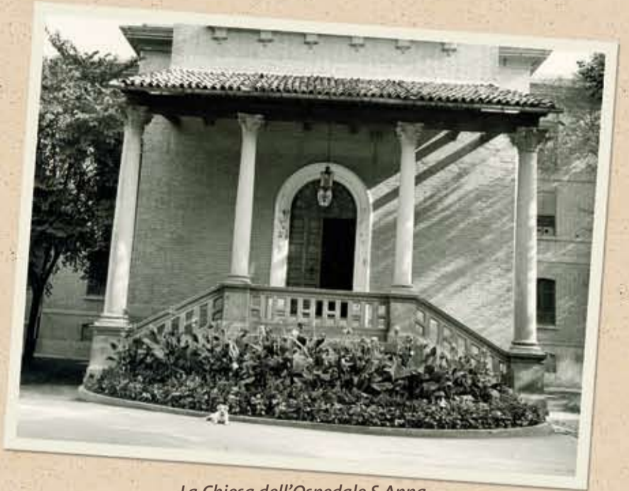
La Chiesa dell'Ospedale S. Anna